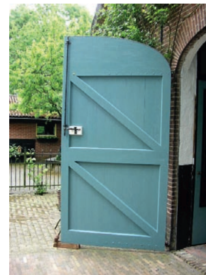
deur met spiegelklampen

Het is verbazingwekkend dat de meeste deuren, sommige van wel 120 tot 150 jaar oud, alleen maar aan de onderzijde verrot zijn. Helaas kunnen ze niet allemaal meer hersteld worden en is het noodzakelijk ze te vervangen. Regelmatig onderhoud en een juiste schilderwijze kan voorkomen dat er een stuk vakmanschap en historie verloren gaat. Van opgeklampte deuren moet vooral de onderzijde goed onderhouden worden. Haal daarvoor de deur uit de steensponning of het kozijn en leg de deur op schragen.