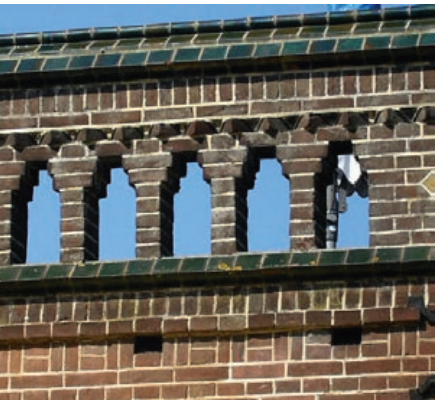
Terwolde, Café De Klok

Om een kleine opening te overspannen is het niet nodig een boog toe te passen. De opening is eenvoudig af te dichten door aan twee zijden van de muur verder uit te bouwen naar het midden. Tegenwoordig legt men er gewoon een latei over: een stalen hulpprofiel of een betonbalk.