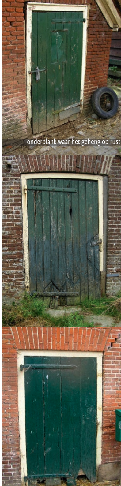
onderplank waar het geheng op rust

Zet de onderkant goed in enkele lagen grondverf. Afschilderen is niet echt nodig. Gebruik verf van goede kwaliteit. Het verlengt de levensduur van de deur aanzienlijk en is dus de extra kosten waard. Bedenk: “wat waard is da’j doet is ook waard da’j ut goed doet” (wat waard is om te doen, is ook waard om goed te doen).