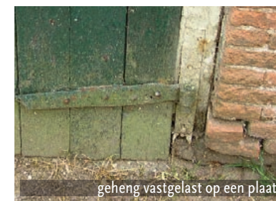
geheng vastgelast op een plaat