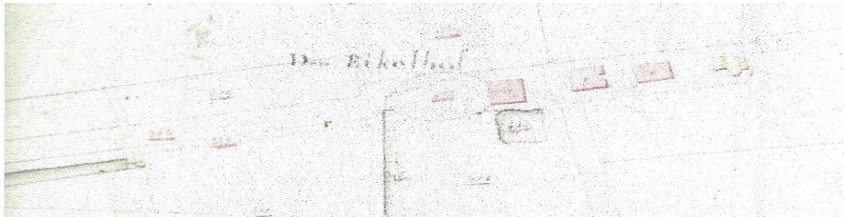
Kadastrale kaart 1811

Volgens de kadastrale kaart uit 1811 was de afgebrande boerderij nog wat breder in aanzet dan het overgebleven gebouw. Ook is in de eerste boerderij een onderschoer aangegeven, wat de daarachter gelegen boerderij niet heeft. Dit duidt er op dat deze boerderij waarschijnlijk is gebouwd als een opslagplaats voor producten die hier verbouwd werden, en nadien tot boerderij is verbouwd. Mede daardoor zijn de gevels later ook diverse malen gewijzigd. De bovenramen in de voorgevel zijn later aangebracht voor bewoning van dat bovengedeelte.