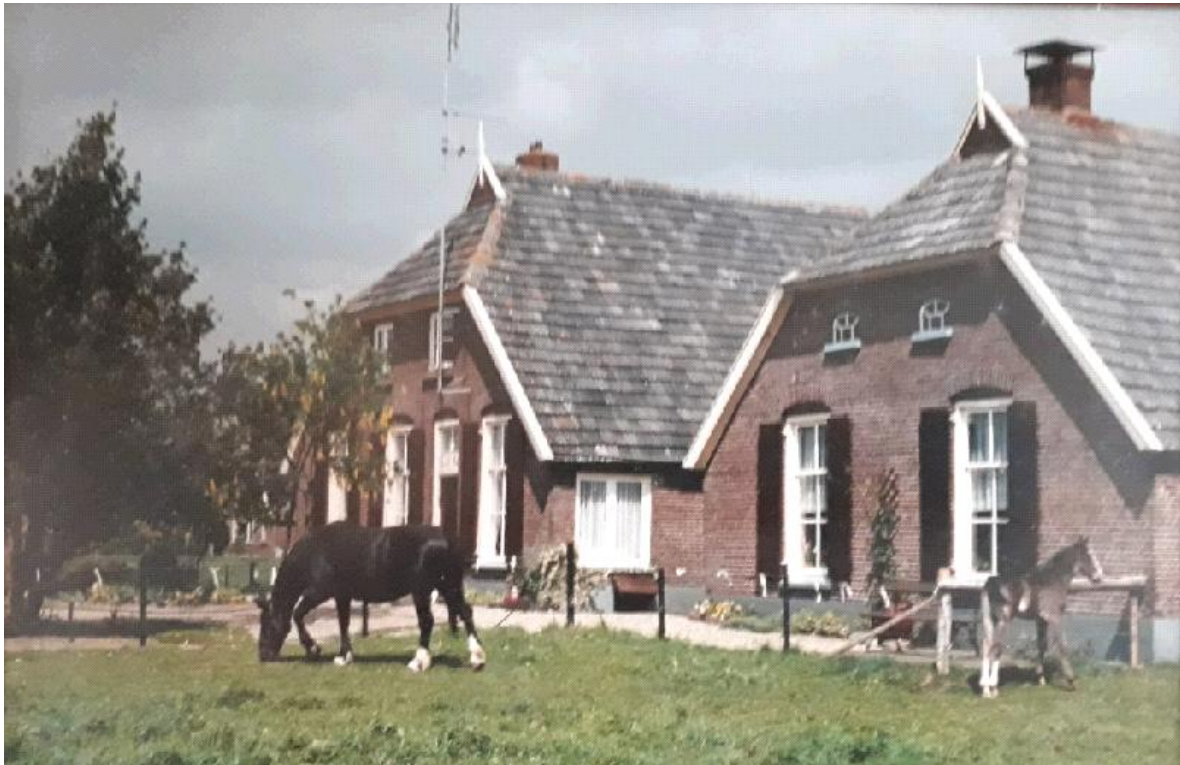
Nieuw Zuidwijk rond 1960