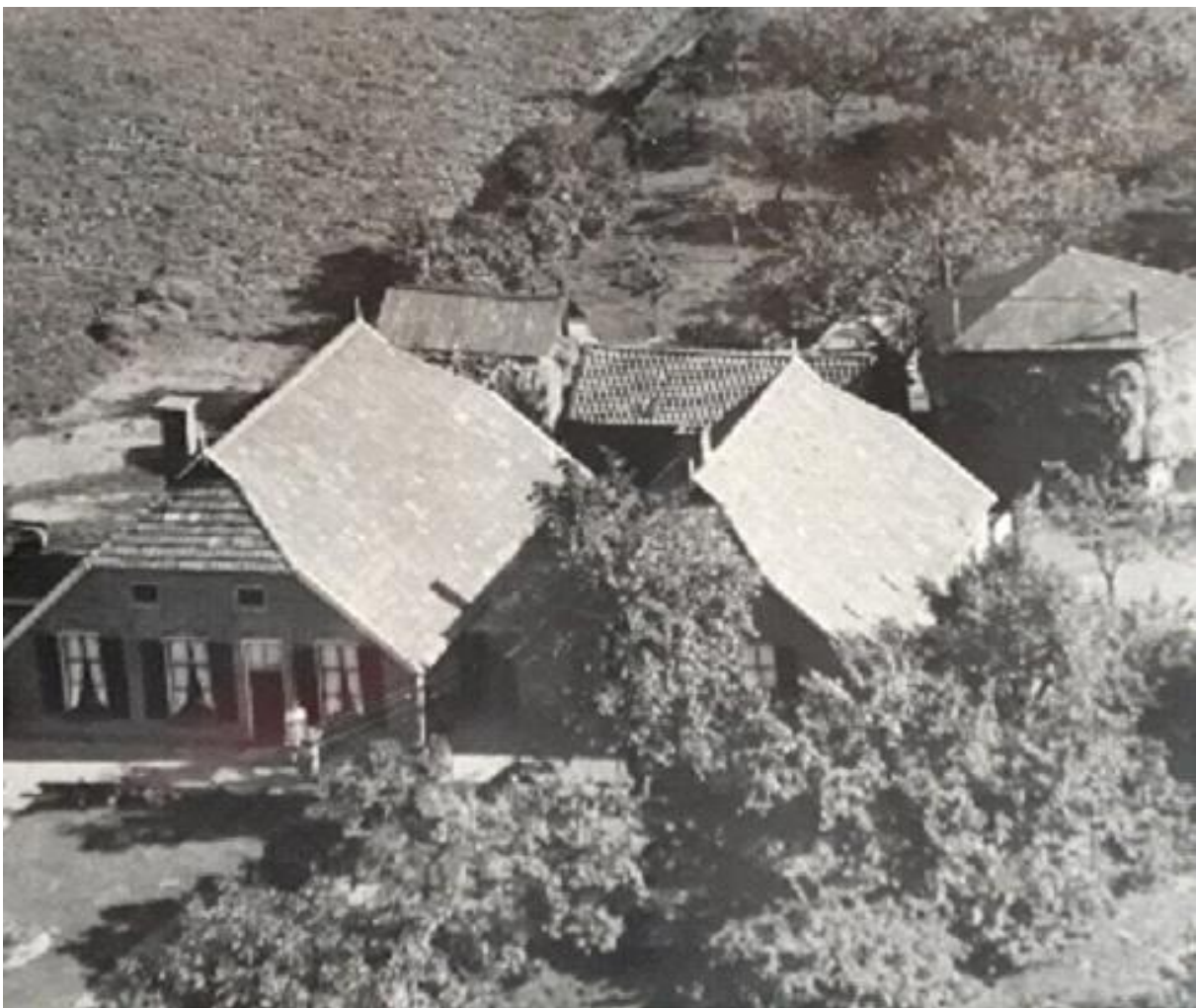
Nieuw Zuidwijk omstreeks 1920