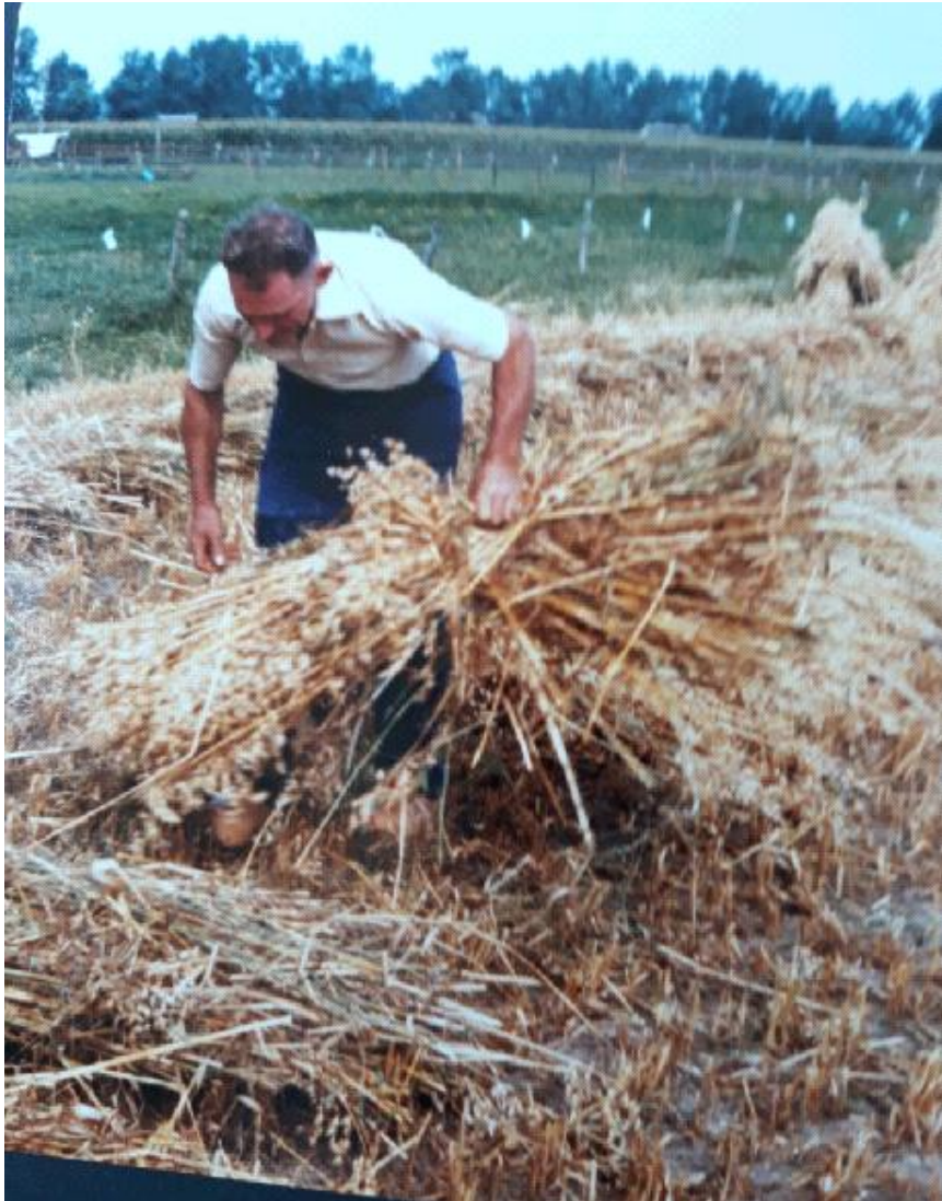
Aart aan het haver binden

Het hofpad liep tussen de bongerd en de tuin, de toegang naar de boerderij langs de groentetuin. De landbouwgrond ligt voor een groot deel rond de boerderij en een aantal percelen verder van huis. Alle percelen droegen namen: De Legenkamp, de Hoge Kamp, Zeiweide, de Rink, de Bult, de Hordekolk, Withagen en Schoenmakerskamp in het Eperbroek, de grond in Vorchten "het Koeland" en 't Oenerbroek. Bij besluit van BenW van Epe werd in 1961 ten behoeve van de reconstructie Weteringdijk-Horthoekerweg 585 vierkante meter overgedragen aan de gemeente. Het Koeland te Vorchten werd in 1973 verkocht, het verre reizen met dieren en/of machines gaf de doorslag.