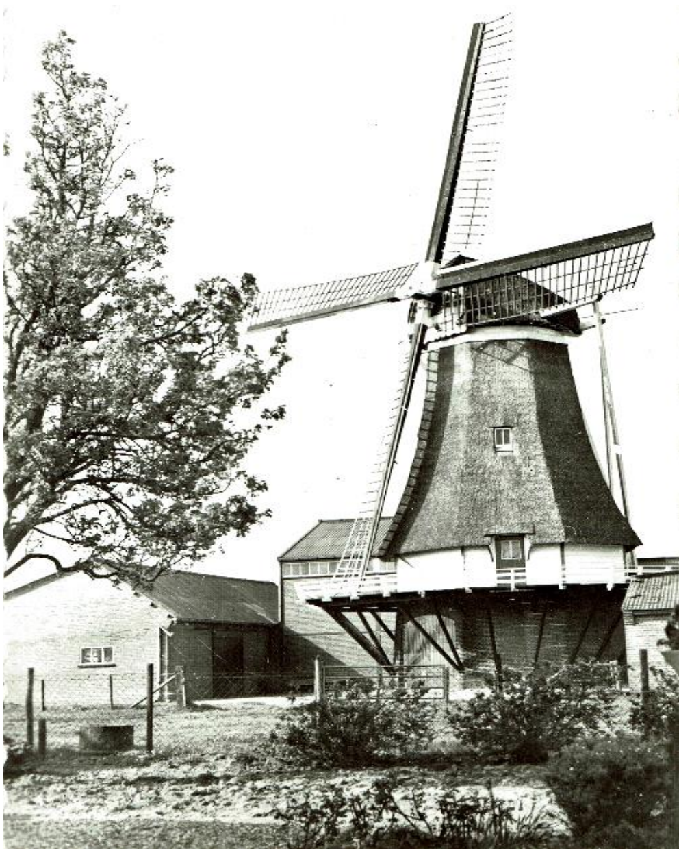
Molen Werklust Oene

Koos was altijd druk, was het een keer wat rustiger dan wilde hij nog wel eens een praatje maken met zijn klanten. Samen rookten ze een dikke sigaar en werden er moppen getapt. Hadden we een feestje van één van de personeelsleden dan werd er een boog gemaakt en stond er een kruiwagen klaar om zo nodig één van de jongens thuis te brengen. Sinterklaas werd gevierd met cadeautjes. Al het personeel kreeg iets persoonlijks met een mooi gedicht erbij en die werden gemaakt door Aaltje. Met al die andere hoogtijdagen was het altijd te druk in de zaak met inhaalwerkzaamheden, de dagen die we misten werden vooraf geregeld. Het vee kan niet zonder voer!